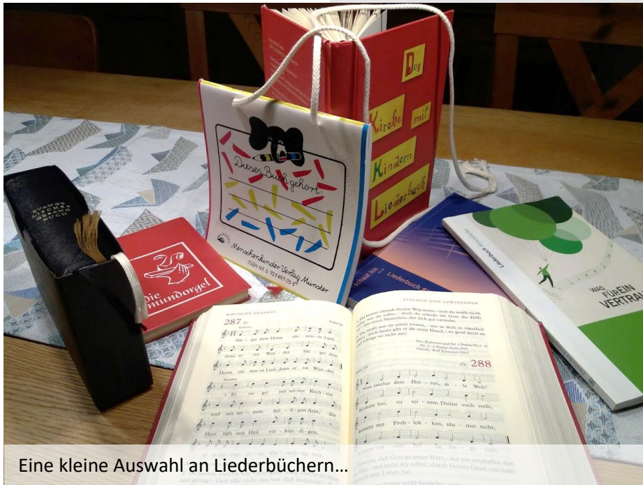
Eine kleine Auswahl an Liederbüchern...

„Lobe den Herrn“ oder „Da wohnt ein Sehnen tief in uns“? „Anker in der Zeit“ oder „Von guten Mächten“? Welches Lied singen Sie am liebsten im Gottesdienst? Was ist Ihr persönlicher Hit? Genauer gefragt: Was ist Ihre TOP 5? Denn genau die suchen wir. Und zwar für das neue Gesangbuch, das bis 2030 erscheinen soll. Zunächst digital, später auch in gedruckter Form.