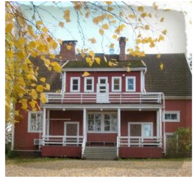
Inselschule Vanamola bei Jorinen in Finnland